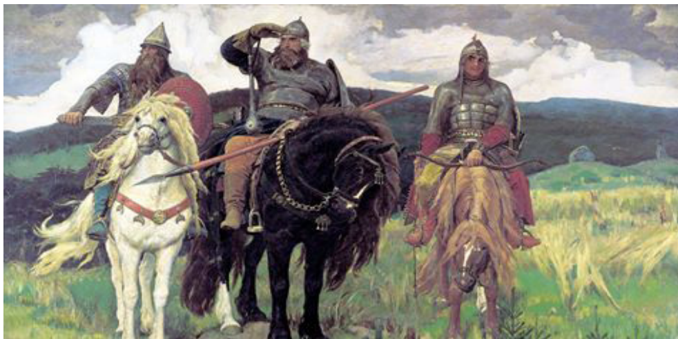
Тримата богатири от руските былини – Иля Муромец Николай Попович и Добрия Никитич

Епосите идват от степта! Те са наситени с духовно отношение и любов към природата – простора и вятъра, слънцето и небето, тревата и дърветата, птиците и зверовете, както и към героите-човеци сред нея. Оттук – от степта – са дошли в билините и имената на противниците на руските богатири – техните побратими половците.